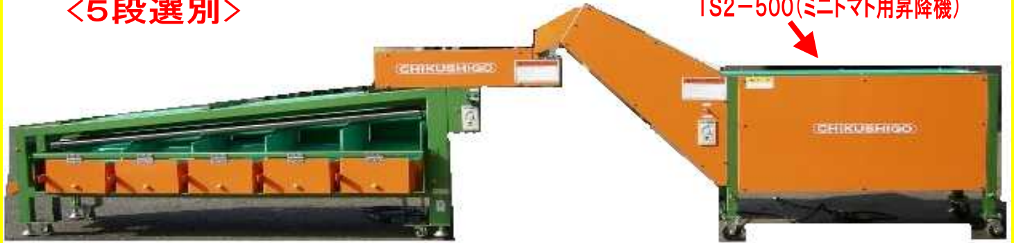
型式 TS2-1500M <5段選別>