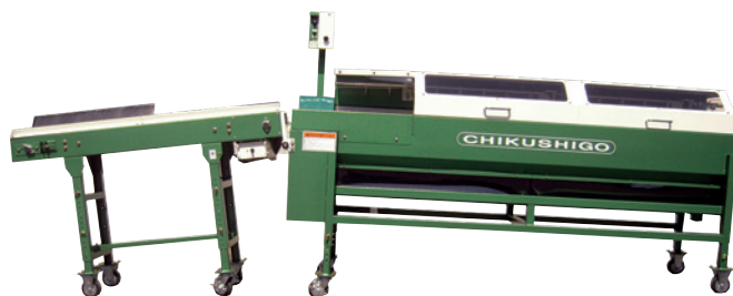
投入コンベア(DK-201)との連結例